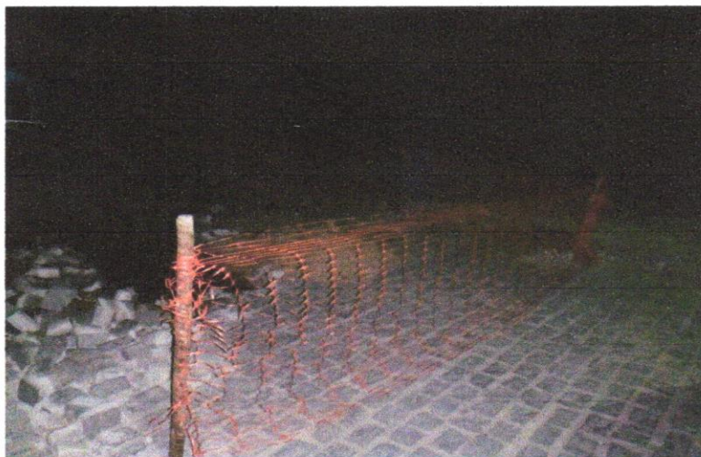
FOTO 01 - Tapume de proteção em tela de polietileno h=1,20 com bloco de concreto