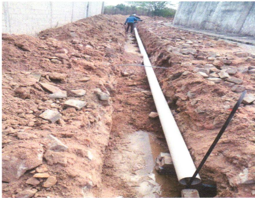
FOTO 03 - ESCAVAÇÃO MANUAL DE VALA COM PROFUNDIDADE MENOR OU IGUAL A 1,30 M

Franklin de J. Costa Eng. Civil CREA-BA 051602557-0