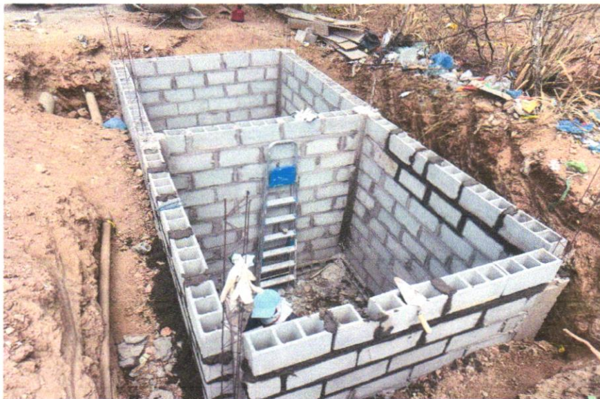
FOTO 05 - ALVENARIA DE BLOCOS DE CONCRETO ESTRUTURAL 14X19X39 CM, (ESPESSURA 14 CM) FBK = 14,0 MPA, PARA PAREDES COM ÁREA LÍQUIDA MENOR QUE 6M 2 , SEM VÃOS, UTILIZANDO PALHETA. AF_12/2014